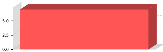
ESTUDIOS DE PREINVERSION POR AMBITO